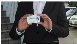
免許を手に記念撮影

9/19 (木) 卒園予定者に説明会を実施。役員の担当との相談会も。 1月に入り、順次申請書(基金6万の使い道)記載→会長と面談 今回の卒園は4名とも長期在籍、まさに双葉学園で育った4人だった。 ・18歳女子(2歳～在籍、県内ホテル就職)・運転免許取得の一部 ・18歳男子(6歳～在籍、県内製造業就職)・運転免許取得の一部 ・18歳女子(2歳～在籍、グループホーム入居) ・携帯購入費の一部 ・18歳男子(2歳～在籍、県内製造業就職)・携帯購入費の一部